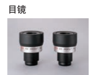
目镜 TSE-9WH 50倍, 广角