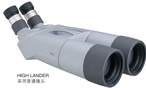
HIGH LANDER 采用普通镜头