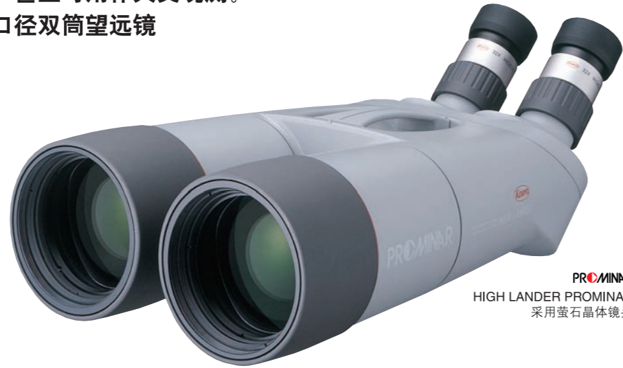
PROMINAR HIGH LANDER PROMINAR 采用萤石晶体镜头

配备82mm大口径物镜超凡亮度及清晰视野，甚至可用作天文观测。 顶级大口径双筒望远镜