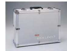
铝制箱 尺寸: 34 cm × 47 cm × 16 cm 重量: 3.4 kg